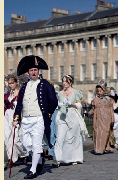
Fein herausgeputzt zum Jane-Austen-Festival.

Freunde der Schriftstellerin ist das Jane Austen Centre in der Gay Street 40 (ein paar Häuser weiter, in der 25, hat die Autorin eine Zeit lang gewohnt). Das Zentrum hat eine eindrucksvolle Sammlung von Kostümen, Dokumenten und Zeichnungen, außerdem einen stilvollen Tearoom. In den nicht weit entfernten Assembly Rooms hat die Schriftstellerin getanzt und gefeiert. Mehr über Jane Austen und das Programm des Festivals finden Sie hier: www.janeausten.co.uk