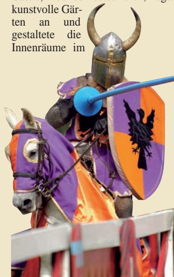
Ritterturniere ziehen viele Besucher an. Unten: Prunkvolles Schlafzimmer im Schloss.

plüschigen, aber ländlichen Stil um. Es wurde Treffpunkt der eleganten Welt, Schauplatz vieler Bälle und Partys, Croquet- und Tennisturniere. Beim Durchwandern des Schlosses sieht man die Gäste von einst, lässig-schick und mit dem Gin Tonic in der Hand, förmlich vor sich.