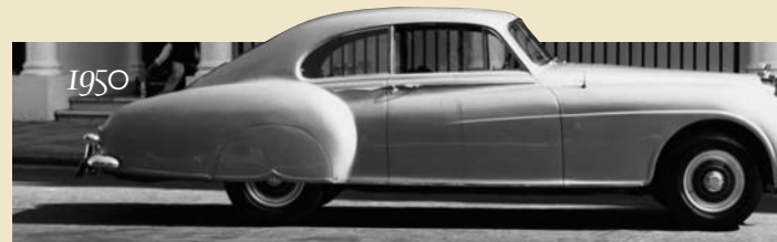
Edles Design – historische Bentley-Limousinen