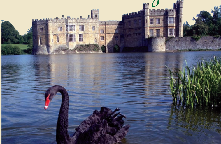
Imposantes Wasserschloss: Leeds Castle im Süden Englands. Der schwarze Schwan ist Symboltier des herrschaftlichen Anwesens.